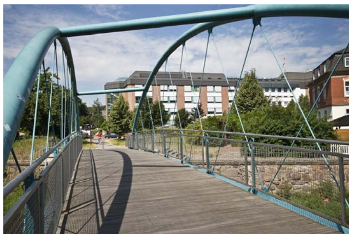
Bereits im Jahre 2000 ist eine interdisziplinäre Abteilung Diabetes und Diabetischer Fuß am Klinikum Freital etabliert worden.

Und: es stimmte die Chemie zwischen den Playern der verschiedenen Fachdisziplinen, ein nicht zu unterschätzender Faktor für den Erfolg einer solchen interdisziplinären Abteilung. Das bedeutet auch, dass die Patienten in dieser Abteilung un-